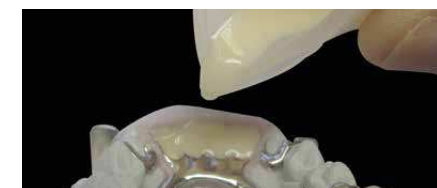
Gießen von top.lign professional im Vorwall