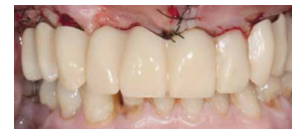
Arbeit in situ