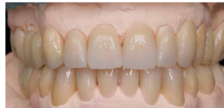
Brücke aus top.lign professional