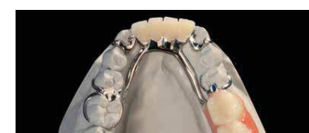
Arbeit auf dem Modell