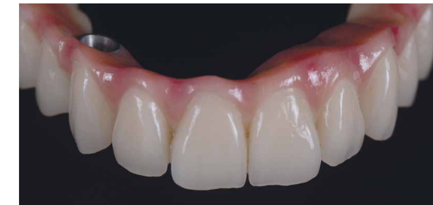
Brücke aus top.lign professional und ausgearbeiteter Gingiva, mit crea.lign individualisiert

Bilder: ZT Christian Dalla Libera, Padua, Italien