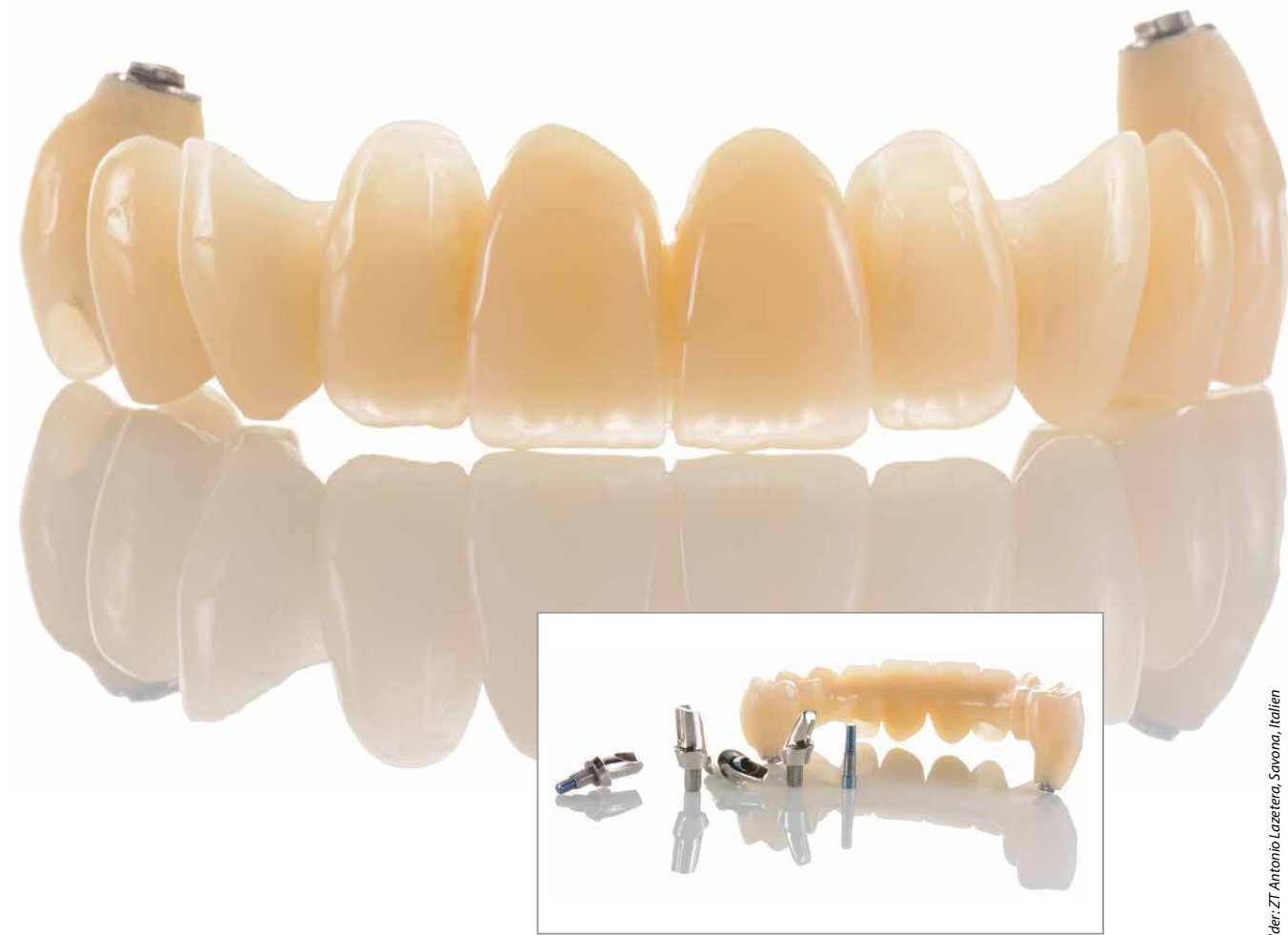
Bilder: ZT Antonio Lucetere, Savona, Italien