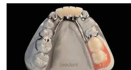
Ouvrage sur le modèle