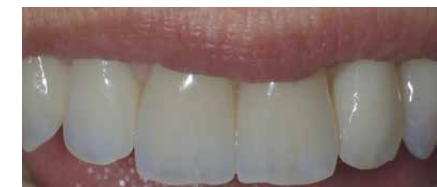
Ouvrage in situ