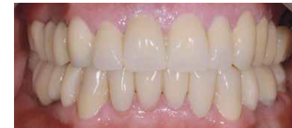
Ouvrage in situ