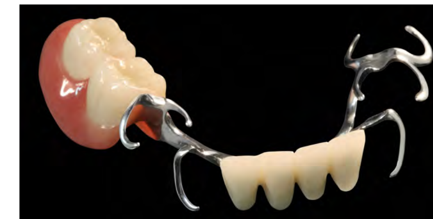
Кламмерный протез из top.lign professional «топ.лайн профессионал» и облицовочных оболочек novo.lign «ново.лайн»