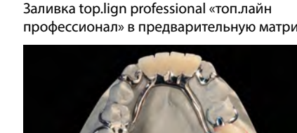
Протез на модели