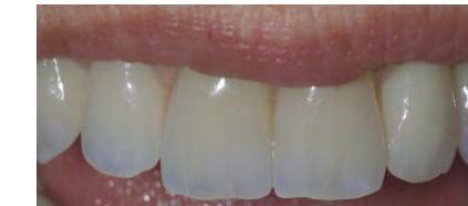
Протез в полости рта пациента