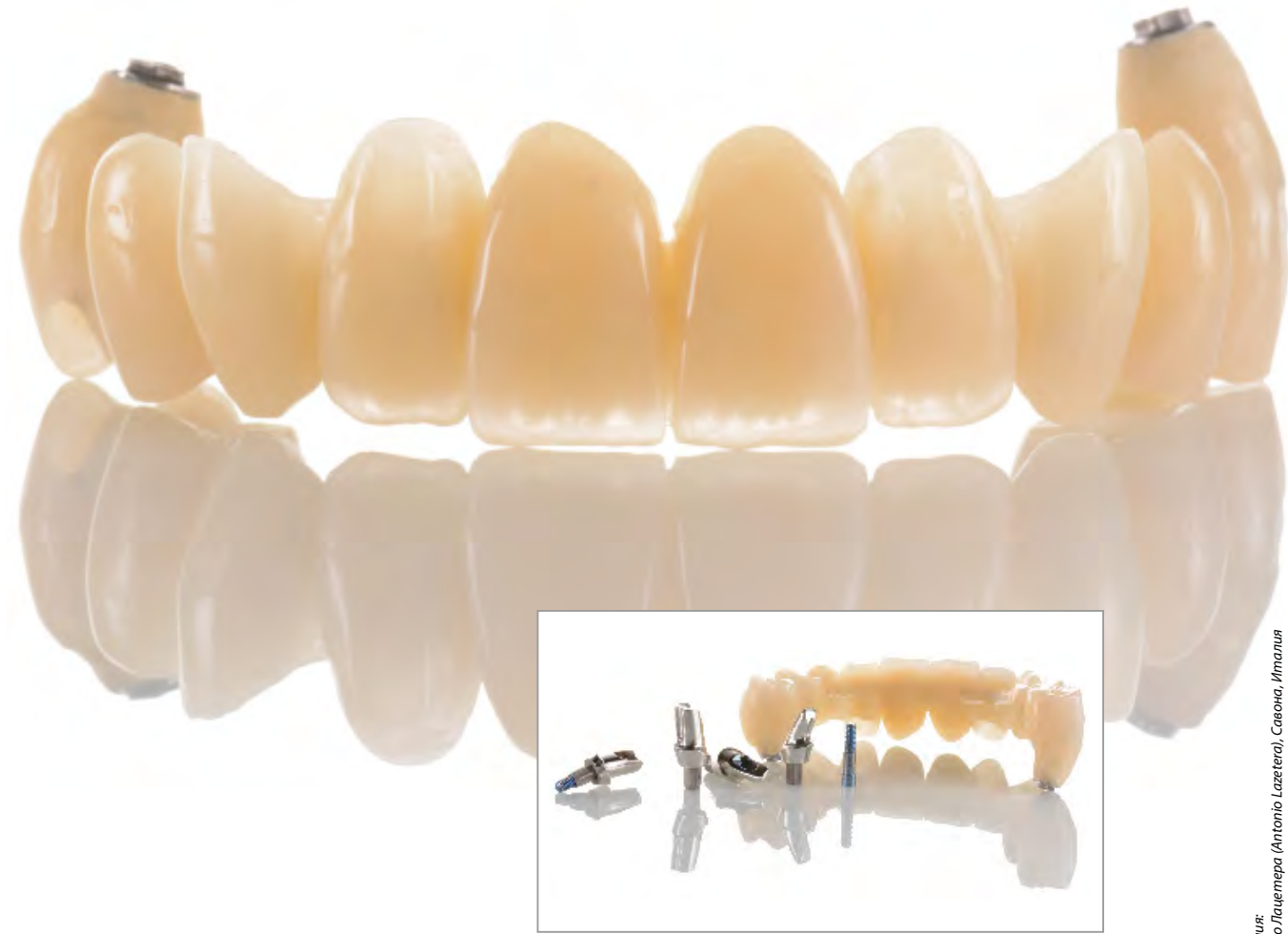
Изображение: ST Антонио Лазеттери (Antonio Lazetteri), Савона, Италия

...для эффективного изготовления рассчитанных на длительный срок временных конструкций и постоянных зубных протезов в области протезирования на имплантатах