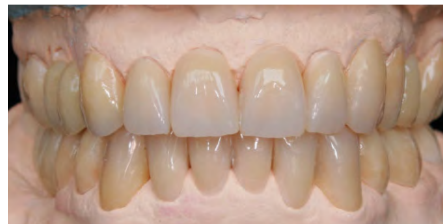
Мост из top.lign professional «топ.лайн профессионал»