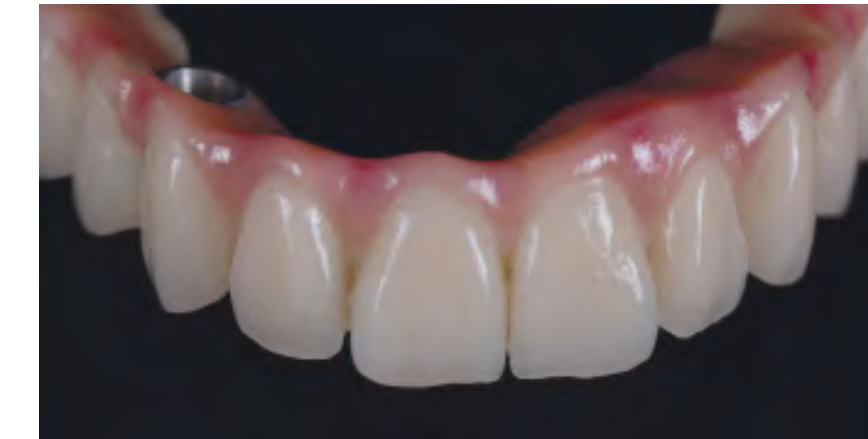
Мост из top.lign professional «топ.лайн профессионал» и обработанной десны, индивидуализирован с помощью crealign «креа.лайн»

Изображения: ЗТ Кристиан Далла Либера (ZT Christian Dalla Libera), Падуа, Италия