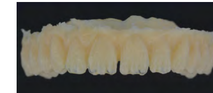
top.lign professional «топ.лайн профессионал» в необработанном виде