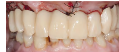
Протез в полости рта пациента