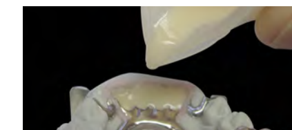
Заливка top.lign professional «топ.лайн профессионал» в предварительную матрицу