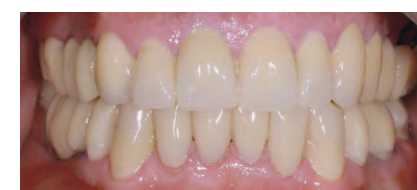
Протез в полости рта пациента