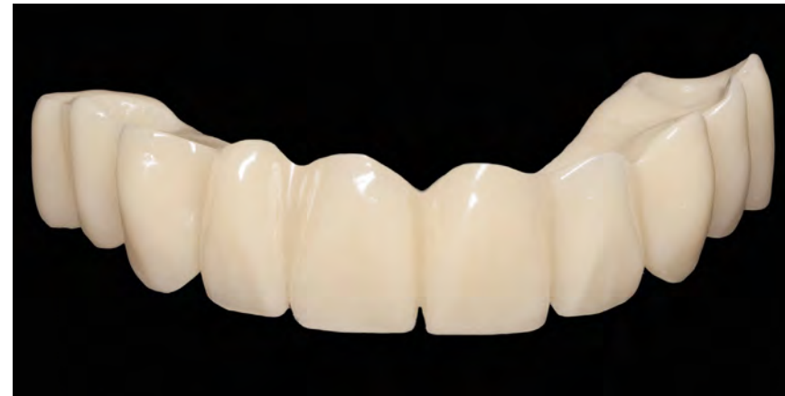
Подлежащий немедленной нагрузке мост, монолитно изготовленный из top.lign professional «топ.лайн профессионал»