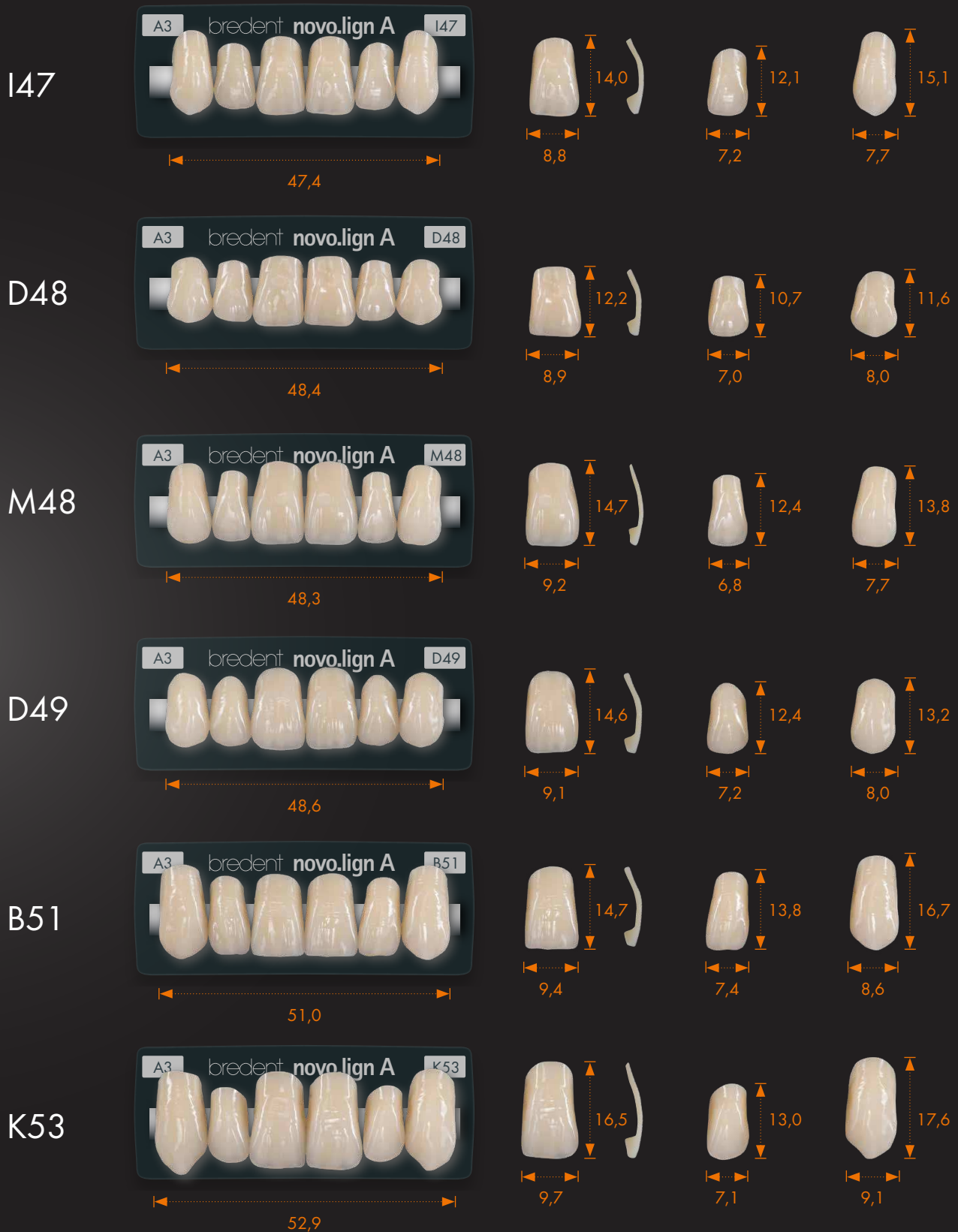
Imagen 1:1, medida en mm

Grosor de la faceta en la zona cervical y zona central de 1 mm