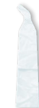
Penguin II Cover 1 Set (20 Stück) REF 580PENG C