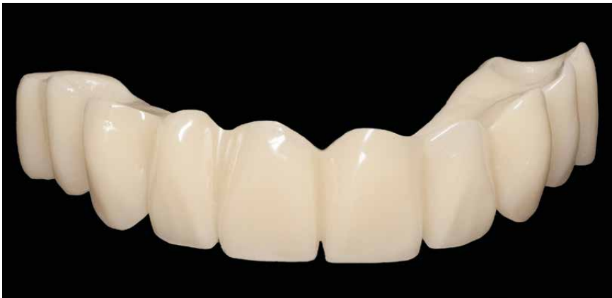
Puente con carga inmediata, monolítico de top.lign professional