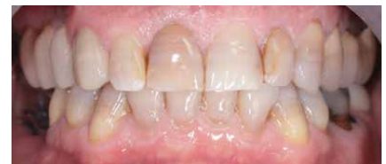
Situación de partida