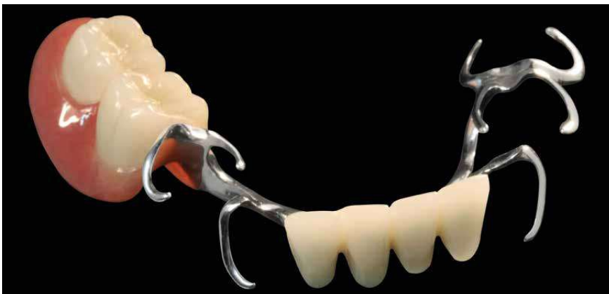
Esquelético con top.lign professional y carillas de revestimiento novo.lign