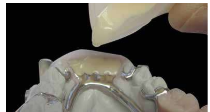
Vertido de top.lign professional en la llave