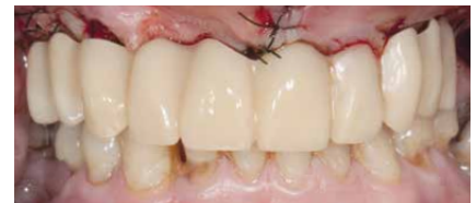
Trabajo in situ