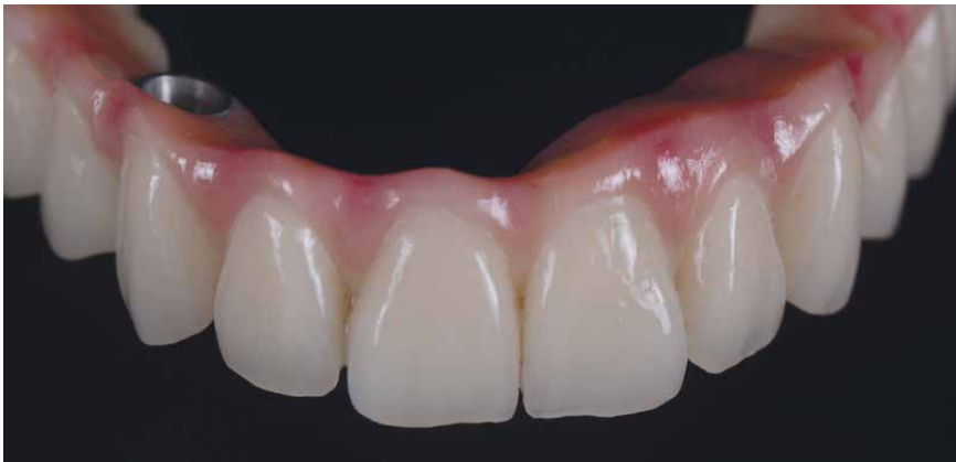
Puente de top.lign professional y encía terminada, personalización con crea.lign

Imágenes: TD Christian Dalla Libera, Padua, Italia