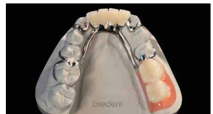
Trabajo sobre el modelo