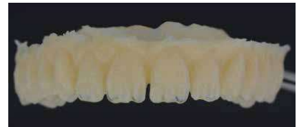
top.lign professional sin procesar