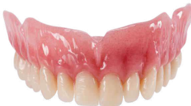
Protesi totale per arcata superiore in uni.lign PF30 (venato) e denti neo.lign (forma H46)