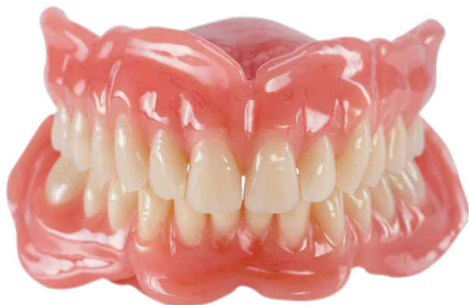
Protesi totale per arcata superiore e inferiore in uni.lign PF40 (venato) e denti neo.lign (forma arc. sup.: I47; forma arc. inf: T35)