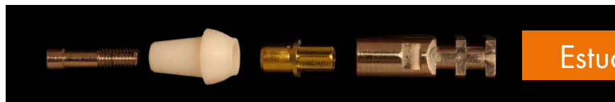
Estudio in vitro

Imagen*: Componentes del aditamento híbrido de óxido de circonio con análogo del implante